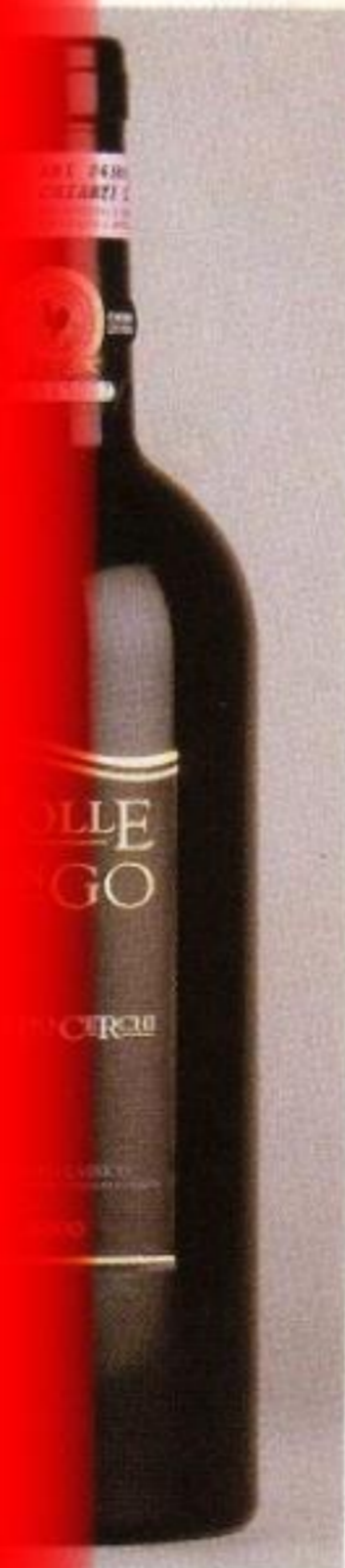
Classico 2000 "Archi" lungo

logie molto diverse tra le Chianti Classico di Carobbio ne fatto maturare sia in barrique nuove sia in altre già utilizzate comunque fatte con un legno di media tostatura. Il vino è quindi molto equilibrato, con un'acidità che si fa sentire e il suo sapore dura a lungo