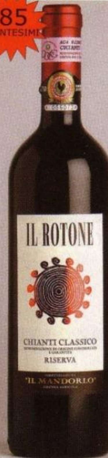
Chianti Classico Riserva 2000 "Il Rotone" Az. Agr. Il Mandorlo 17 euro