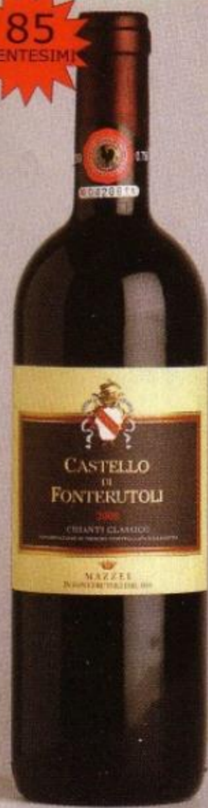
Chianti Classico Riserva 2000 Castello di Fonterutoli 35,50 euro