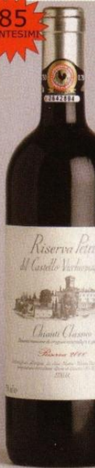
Chianti Classico Riserva 2000 "Petri" Castello Vicchiomaggiore 23,50 euro